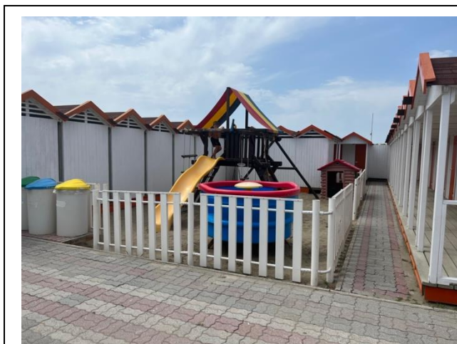
Area giochi per bambini